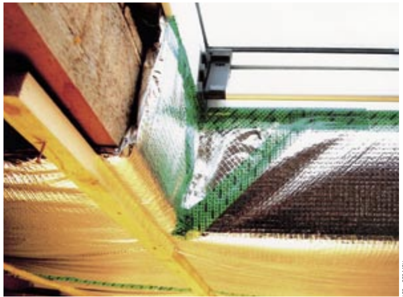
LPS - GES MBH

Lu..po.Therm B 2+8 ist für den Einsatz als nicht druckbelastete Wärmedämmung auf, zwischen oder unter Sparren- und Balkenlagen bauaufsichtlich zugelassen. Das Bild zeigt einen Ausbau unter den Sparren mit einem Dachfensteranschluss