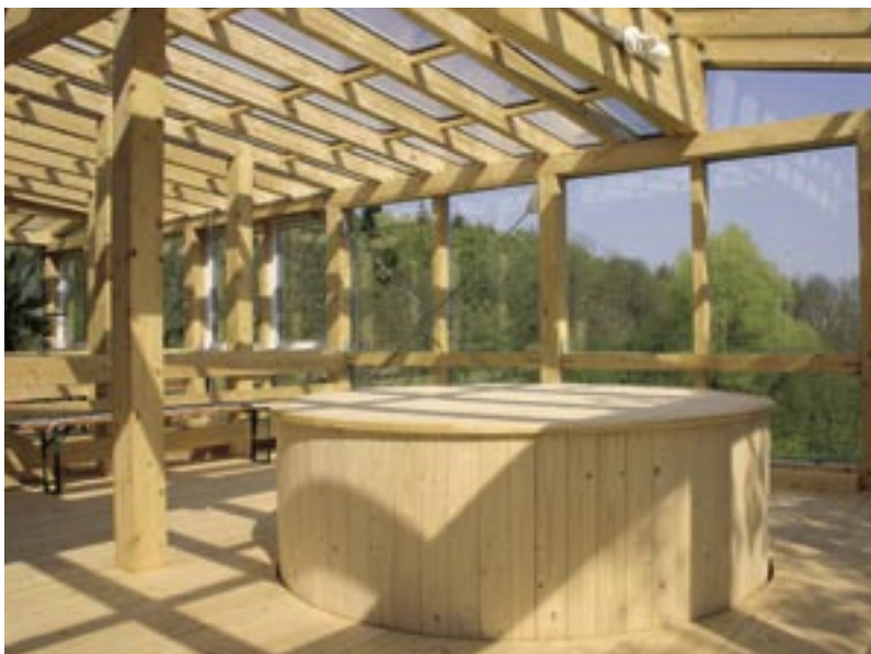
Oberteil des über zwei Geschosse reichenden runden Speichers im Solarzentrum Mecklenburg-Vorpommern. Unter der Brettschalung befindet sich eine foliengedämmte Holzkonstruktion