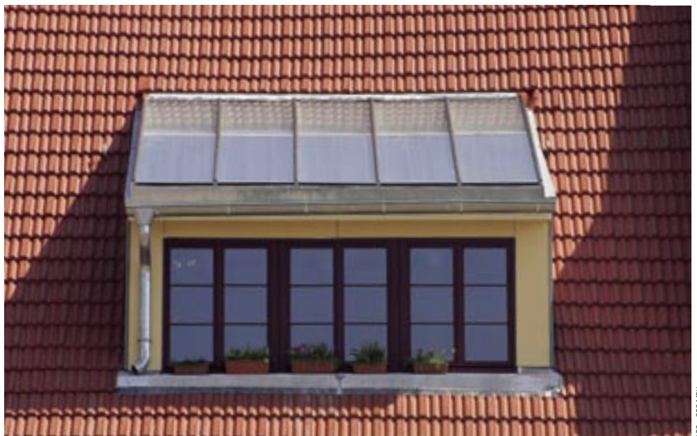
Der Solarkollektor ist rückseitig mit einer Kombination aus Zellulose und Luftpolsterfolien gedämmt. Die geringe Höhe des Aufbaus auf dem Gaubendach wahrt die architektonischen Proportionen des Hauses

Für das Solarzentrum Mecklenburg-Vorpommern hatte Architekt Gerd Vogt die Aufgabe, einen 10 m 3 fassenden Solarspeicher einerseits zu dämmen und andererseits architektonisch gelungen in einen wintergartenartigen Vorbau zu integrieren. Er errichtete rund um den aufrecht stehenden Stahltank eine zylindrische Holzkonstruktion und bespannte sie umlaufend mit Lu..po.Therm B2+8. Die Anpresslatten der Wärmedämm-Matte dienen zugleich als Unterkonstruktion für die Sichtschalung. Die Lösung eines anderen speziellen Problems gelang Architekt Gerd Vogt bei der Sanierung eines